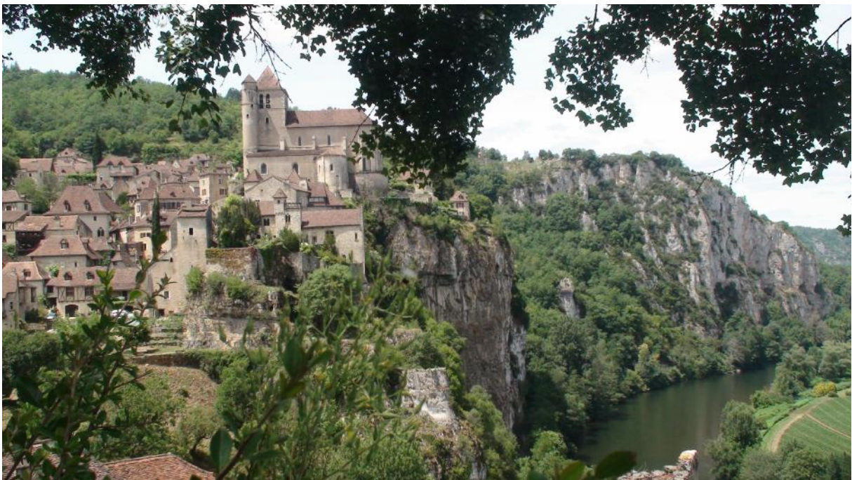
Saint-Cirq-Lapopie, parel van de vallei van de Lot